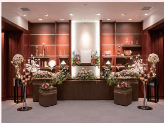
小規模葬専用式場

「癒やし」と「安らぎ」をコンセプトにした、あらゆるご葬儀に対応した式場です。式場、飲食会場ともゆったりと椅子の間隔を広げ配置いたします。