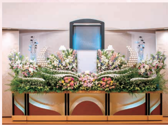
あらゆるご葬儀に対応