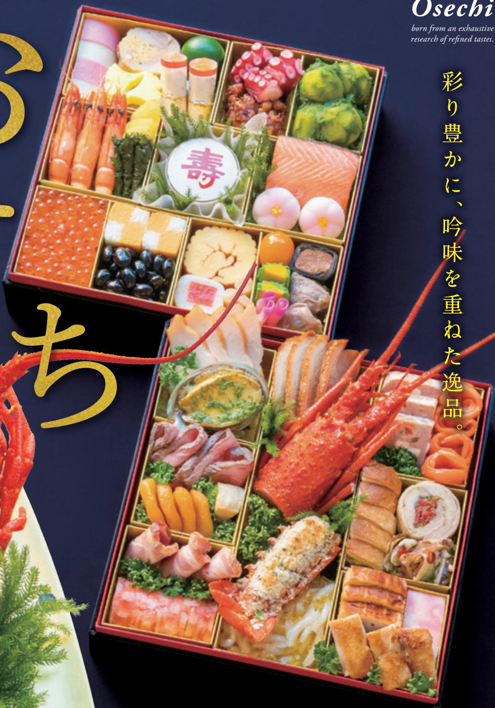
※盛り付けイメージ 2段重(1段 / 24.5×24.5×6cm)

〈ご予約承り期間〉 12/25(日)迄 お渡し日は12/31(土)となります。 ※数量に限りがありますので、お早めにご予約ください。