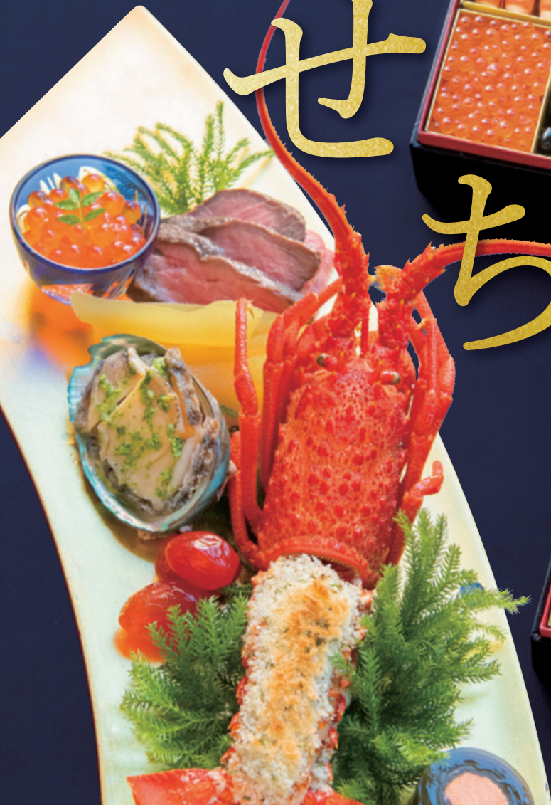
※盛り付けイメージ 2段重(1段 / 24.5×24.5×6cm)

〈ご予約承り期間〉 12/25(日)迄 お渡し日は12/31(土)となります。 ※数量に限りがありますので、お早めにご予約ください。